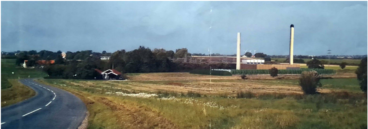
Energi Fyns egen grafiske gengivelse af udsigten mod værket og Hejninge. Til venstre ses Hejninge kirke.

Hvis planerne om et kraftværk bliver til virkelighed, vil sceneriet tage sig helt anderledes ud. Blikket vil blive indfanget af to skorstene, hvoraf den ene er høj som Rundetårn. Disse to skorstene vil de næste kilometer ikke forlade udsynet, men derimod kun blive større. Og det samme vil ske på tilbagevejen. De vil i den grad skæmme terrænet omkring vores elskede Hejninge.